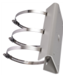
DS-1275ZJ Крепление на столб