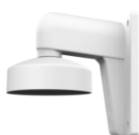
DS-1272ZJ-110 Настенный кронштейн