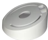
DS-1259ZJ Потолочное крепление