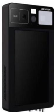
Рисунок 1 – Общий вид терминала, входящего в состав комплексов серии DS-M модели DS-MDH005-B

Фотографии общего вида компонентов комплексов измерительных тепловизионного контроля стационарных серий DS-K, DS-M приведены на рисунках 1-5. Структура системы представлена на рисунке 6.