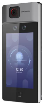
Рисунок 3 – Общий вид терминала, входящего в состав серии DS-K модели DS-K1T671TM-3XF