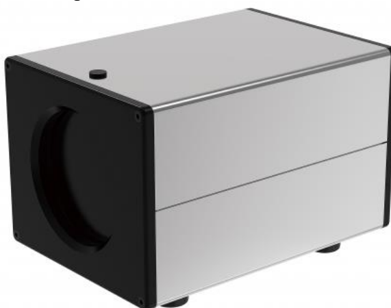
Рисунок 6 – Общий вид АЧТ