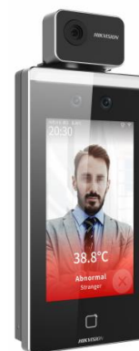
Рисунок 4 – Общий вид терминала, входящего в состав серии DS-K модели DS-K1TA70MI-T