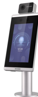
Рисунок 2 – Общий вид терминала, входящего в состав комплексов серии DS-K модели DS-K5671-3XF/ZU